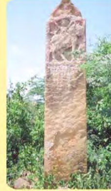
કુંભાજનો પાળિયો ગામ : નાનીઅરલ, પ્ર.-૬