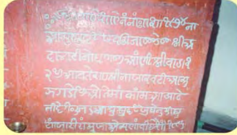
અજાજીના પાળિયા નીચેનું લખાણ ગામ : માનકૂવા, પ્ર.-૩