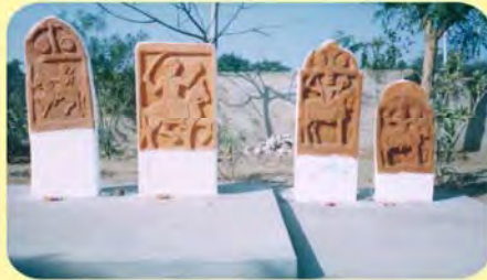
ડાબેથી પ્રથમ અજાજીનો તથા બીજો જીવણજીનો પાળિયો ગામ : તલવાણા, પ્ર.-૪