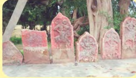
જામ્બાઈ વાડીમાં આવેલ પાગિયા ગામ : ભડલી, પ્ર.-૬