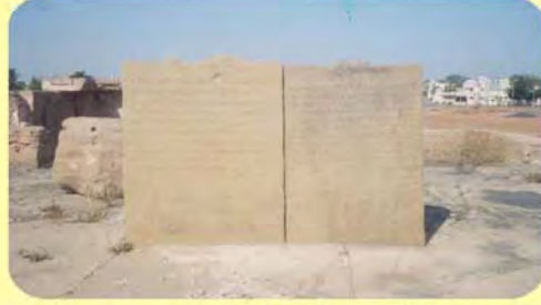
ડાબેથી પ્રથમ ભારમલ્લજી(પહેલા)નો તથા બીજો લીલાવતીનો પાળિયો ગામ : ભુજ, પ્ર.-૩