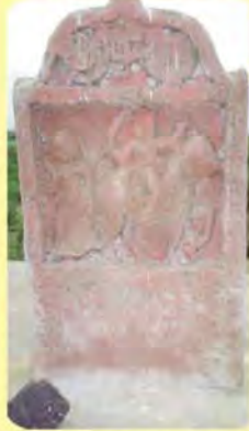
નેણભાઈ સતીનો પાળિયો ગામ : ચાવડકા, પ્ર.-૬