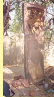
વાઘોબારીનો પાળિયો ગામ : ગેડી, પ્ર.-૭