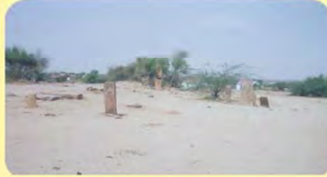
ઢોલીથરમાં આવેલાં પાણિયા ગામ: વજવાણી, પ્ર.-૭