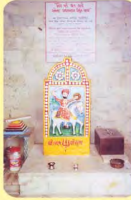
જેઠાણદદાદાનો પાળિયો ગામ : માપર, પ્ર.-૪