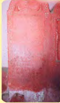
હાલાજીના પાળિયાનું લખાણ ગામ : ભદ્રેશ્વર, પ્ર.-૫