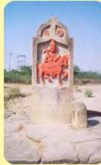
ઢોકળા ગામમા આવેલ પાળિયો ગામ : ઢોકળા, પ્ર.-૪