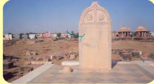
રા'દેશળજી(બીજા)નો પાળિયો ગામ : તુજ પ્ર.-૩