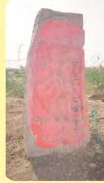
જીવા દાદલનો પાળિયો ગામ : સણવા, પ્ર.-૭