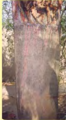
વાઘોબારીનો પાળિયો (લખાણવાળો ભાગ) ગામ : ગેડી, પ્ર.-૭