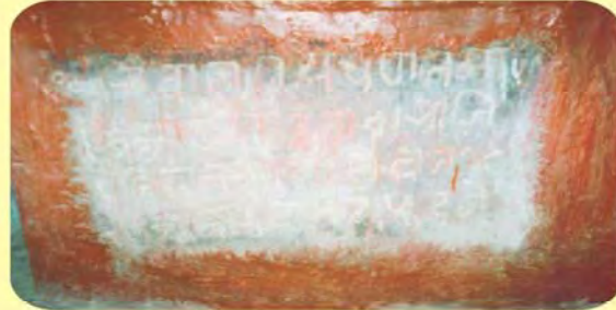
જાડેજા વાજાજના પાળિયા નીચેનું લખાણ ગામ : કેરા, પ્ર.-૩