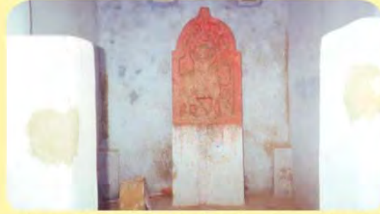
રખેશ્વર મંદિરની બાજુની છતરડીમાં રહેલ જેતમાલજનો પાળિયો ગામ: વિંઝાણ, પ્ર.-૮