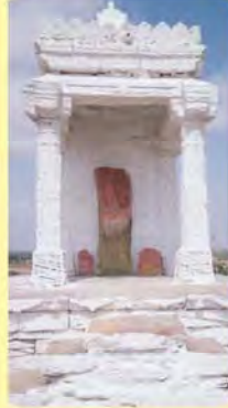
ઊંચા પાળિયામાં કાબી બાજુ રવોજી જમણીબાજુ રાહોજીનો પાળિયો ગામ : કીડિયાનગર, પ્ર.-૭