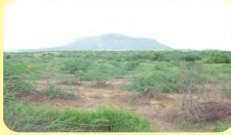
ધીણોધર ડુંગર, પ્ર.-૬