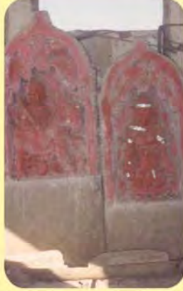
જમણેથી પ્રથમ સતી રૂપાળીબાનો પાળિયો ગામ : ભુજ(છતરડી વિભાગ), પ્ર.-૩