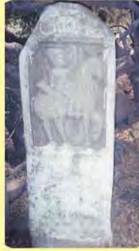
આમરજ અખેરાજજનો પાળિયો (ગાયોની વારે થયેલો) ગામ : લોદ્રાણી, પ્ર.-૭