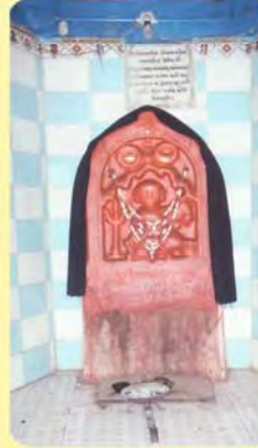
આંબાસતી/પુત્ર ઉમરદાન પાછળ ગામ : મોરઝર, પ્ર.-૬