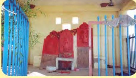
જશોદામાના પાળિયા ગામ : વીંગણિયા, પ્ર.-૪