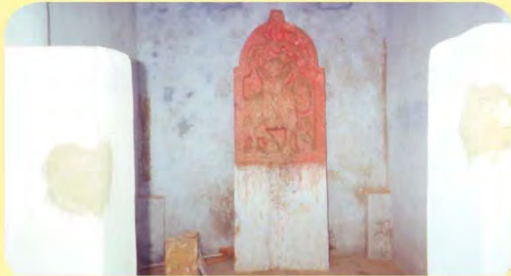
રખેશ્વર મંદિરની બાજુની છતરડીમાં રહેલ જેતમાલજીનો પાળિયો ગામ: વિંઝાણ, પ્ર.-૮