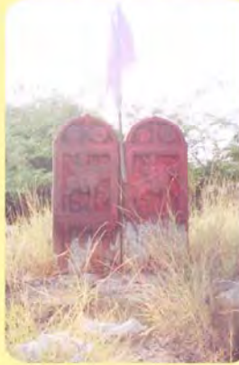
ડાબેથી ખાનજીનો તથા ખીમોજીનો પાળિયો ગામ : મોટી ભાડાઈ, પ્ર.-૪