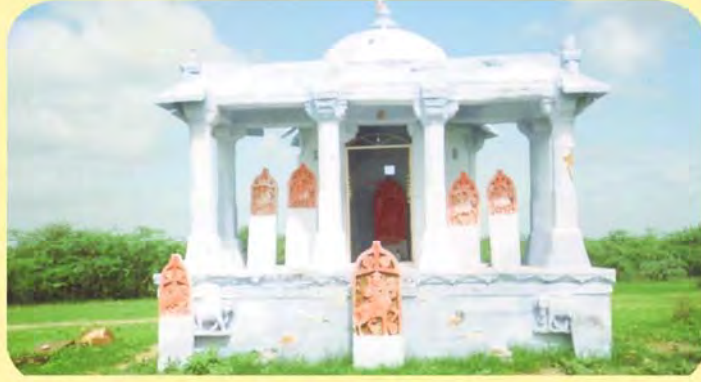
જામ હમીરજીની છતરડી જેમાં ગર્ભમાં જામ હમીરજીનો પાળિયો તથા તેના સાથીદારોના પાળિયા ગામ: બારા(તેરા), પ્ર.-૮