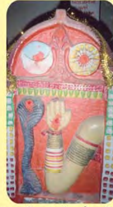
મચ્છર જ્ઞાતિના સતીમાનો પાળિયો ગામ : ભુજ (છતરડી વિભાગ), પ્ર.-૩