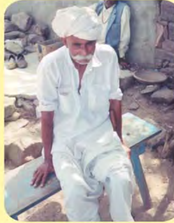
ભુરુભા આર. વાઘેલા ગામ : કીડિયાનગર