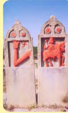
કરણજી તથા લાંછુબાના પાળિયા ગામ : ઢોકળા, પ્ર.-૪