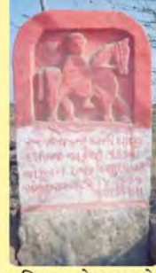
જાડેજા અલિયાજ દેશળજનો પાળિયો ગામ : ચિત્રોડ, પ્ર.-૭