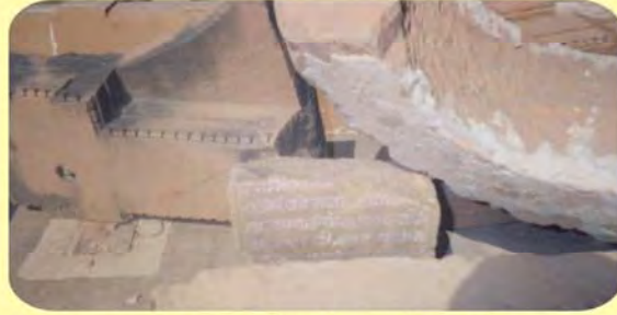
મહારાવ શ્રી પ્રાગમલજી(બીજા)નો પાળિયો ગામ : ભુજ, પ્ર.-૩