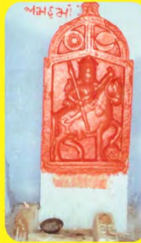
જામ હમીરજીનો પાળિયો ગામ : બારા-તેરા, પ્ર.- ટ