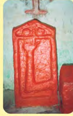
રૂપકુંવરબા સતીનો પાળિયો ગામ : વડવા(હોથી), પ્ર.-૩