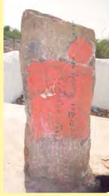
કાનજી મેરૂજીનો પાળિયો ગામ: દેશલપર, પ્ર.-૭