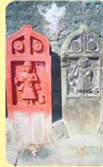
જનકબાના પાળિયા ગામ : ડોણ, પ્ર.-૪