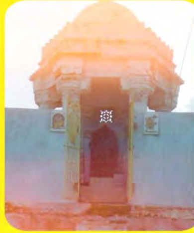
તેજમાલજીનો પાળિયો ગામ : વિંઝાણ, પ્ર.- ટ