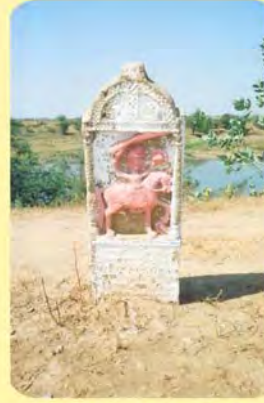
મલુજી બારાતનો પાળિયો ગામ : નાથેચા, પ્ર.-૪