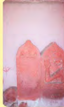
રૂપાળીબા તથા હાલાજીના પાળિયા ગામ : ભદ્રેશ્વર, પ્ર.-૫