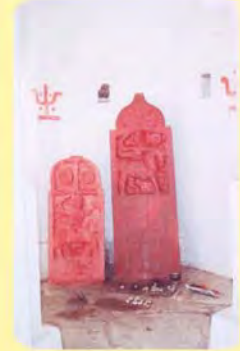
પૂજા રોહડિયાનો પાળિયો (ઊંચો પાળિયો) ગામ : જામથડા, પ્ર.-૪