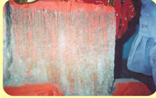
બેનબાઈ સતીના પાળિયા નીચેનું લખાણ ગામ : લાખોંદ, પ્ર.-૩