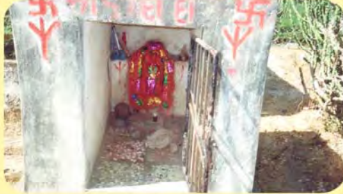
કેસરજી હાજાજીનો પાળિયો ગામ : નાગેચા, પ્ર.-૪