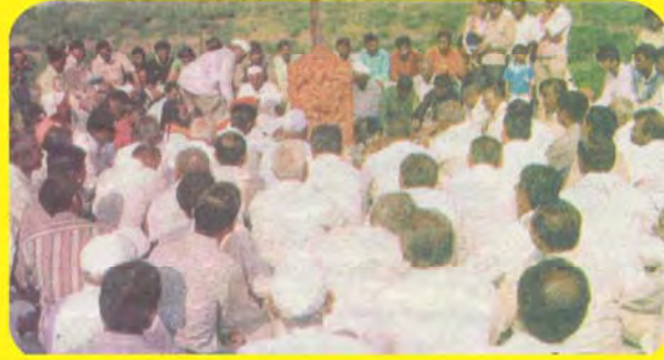
વીર અલિયાજી નો પાળિયો ગામ : કોરા, તા: લખપત. પ્ર.- ટ