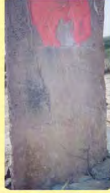
જેમલજીના પાળિયા નીચેનું લખાણ ગામ : મોટી રવ, પ્ર.-૭