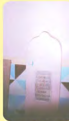
વારૂ બારોટનો પાળિયો ગામ : કાઠડા, પ્ર.-૪