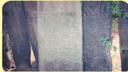
જાનના પાળિયા નીચેનું લખાણ ગામ: ભીમદેવકા, પ્ર.-૭