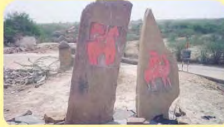
જેમલજીનો પાળિયો (ઘોડેસવારીવાળો) ગામ: મોટી રવ, પ્ર.-૭