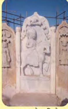
લખપતજીનો પાળિયો ગામ : ભુજ(છતરડી વિભાગ), પ્ર.-૩