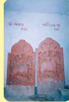
આશાજીદાદા તથા વિભાજીદાદાના પાળિયા ગામ : ગુંદિયાળી, પ્ર.-૪