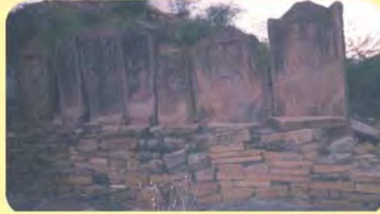
સિંધલ સોઢાના પાળિયા ગામ: ગઢડા, પ્ર.-૭