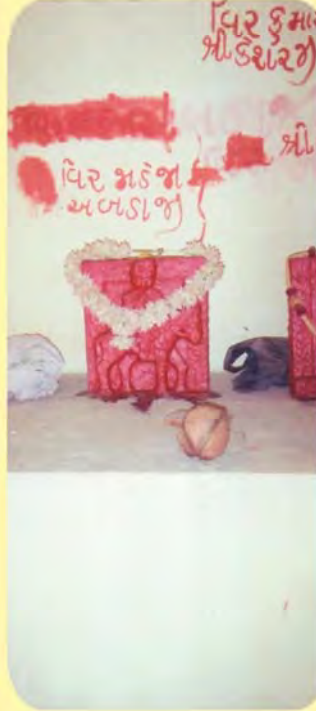
વીર અબડાનો નવો બેસાડેલો પાળિયો ગામ:વડસર, પ્ર.-૮