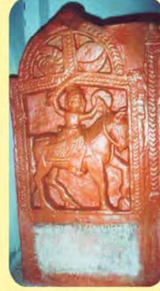
વાજાજીનો પાળિયો ગામ : કેરા, પ્ર.-૩