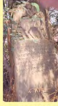
પચાણજના સમયમાં વીર પુરુષનો પાળિયો ગામ : ગેડી, પ્ર.-૭