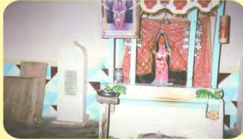
આવડ માતાજીના મંદિરમાં વાડુ બારોટનો પાળિયો ગામ : કાઠડા, પ્ર.-૪