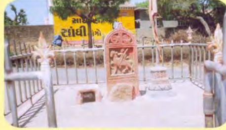
હનુભા તેજમાલજ્ઞનો પાગિયો ગામ : મોટી તુંબડી, પ્ર.-૫