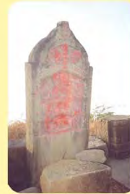
ભોજરાજજીનો પાળિયો ગામ : ભોજાય, પ્ર.-૪