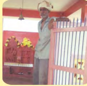
વિજયરાજી એસ.જાડેજા ગામ : ઘાવડા નાના