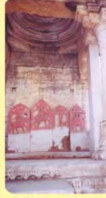
સોનીભાઈઓના પાળિયા ગામ : બારોઈ, પ્ર.-૫