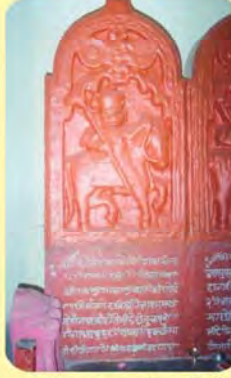
જાડેજા વાઘજીનો પાળિયો ગામ : માનકૂવા, પ્ર.-૩