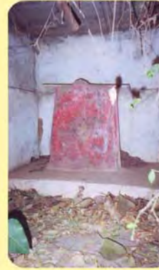
ફરાદીની ખાંભી ગામ : ફરાદી, પ્ર.-૪