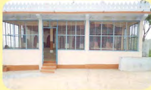
વાનુમા સતીનું ટેકરી પર આવેલું મંદિર ગામ : મોરઝર, પ્ર.-૬