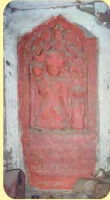
જેઠીનો પાળિયો ગામ : ભુજ(રામધૂન પાસે), પ્ર.-૩