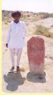
શિવુભાનો પાળિયો તથા તેના માહિતીદાતા ગામ : મખિયાણા, પ્ર.-૫