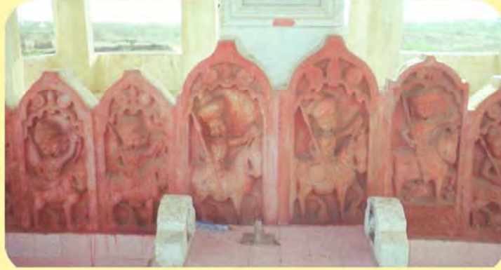
જમણેથી ચોથો વીર લાખાજીનો પાળિયો ગામ: વિંઝાણ, પ્ર.-૮