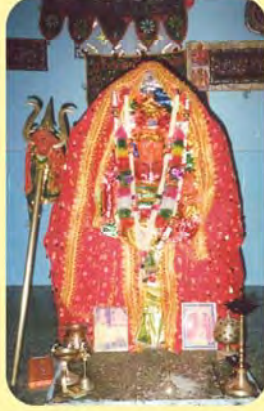
ક્રમાબાઈ સતીનો પાળિયો ગામ : લાખોદ, પ્ર.-૩