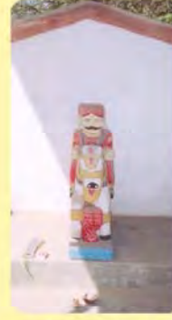
હરધોડજીદાદાની પ્રતિમા ગામ : ટોડા, પ્ર.-૫