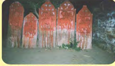
ડાબેથી પ્રથમ સુમરાજનો તથા ત્રીજો વિભાજનો પાળિયો (લખાણમાં ઝારાનો ઉલ્લેખ) ગામ : નાનારેહા, પ્ર.-૩