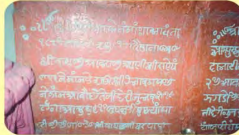
વાઘજી આજાજીના પાળિયા નીચેનું લખાણ ગામ : માનકૂવા, પ્ર.-૩