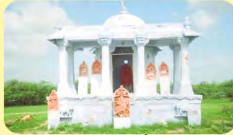
જામ હમીરજીની છતરડી જેમાં ગર્ભમાં જામ હમીરજીનો પાળિયો તથા તેના સાથીદારોના પાળિયા ગામ: બારા(તેરા), પ્ર.-૮