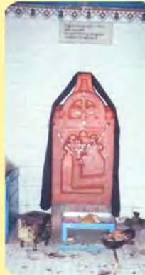
વાનુમા સતીનો પાળિયો ગામ : મોરઝર પ્ર.-૬