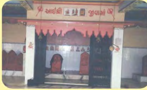
જીવામા સતીનો પાળિયો(ડાબી બાજુથી પ્રથમ) ગામ : લાખીયારવીરા પ્ર.-૬