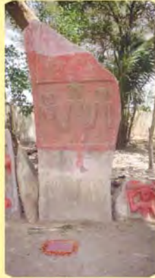
વરણુંના સતીઓના પાળિયા ગામ : વરણું, પ્ર.-૭