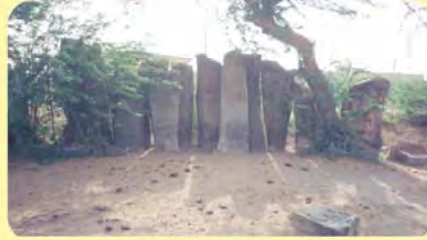
જાનના પાળિયા ગામ: ભીમદેવકા, પ્ર.-૭