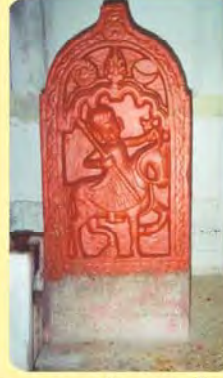
જાડેજા પરવાજી સોગરામજીનો પાળિયો ગામ : કેરા, પ્ર.-૩