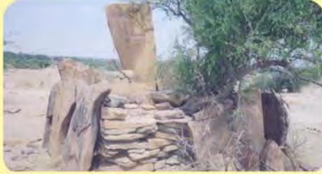
આહિરાણીઓ તથા ઢોલીનો પાણિયો ગામ: વજવાણી, પ્ર.-૭