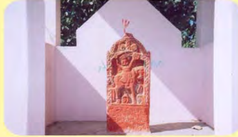
દેથરની છતરડી ગામ : ફરાદી, પ્ર.-૪