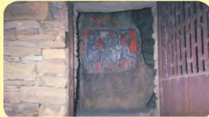
ડાબી બાજુનો સિંધલ રણમલજીનો તથા જમણી બાજુનો ભોજરાજીનો પાળિયો ગામ: ગઢડા, પ્ર.-૭