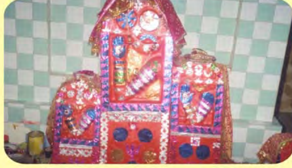
ડાબી બાજુથી પ્રથમ રૂપબાની દીકરી બીજો રૂપબા તથા ત્રીજો રતનબાનો પાળિયો ગામ : ભુજ, પ્ર.-૩