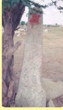
વીર વનાજીનો પાળિયો ગામ : પલાંસવા, પ્ર.-૭