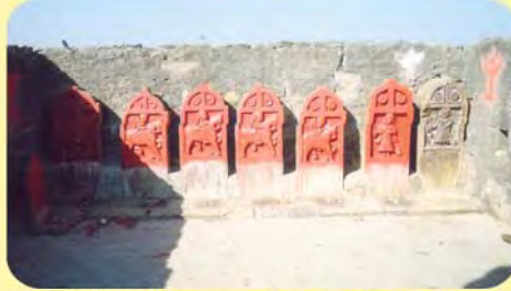
જમણેથી છેલ્લા બે જન્કબા જાડેજાના પાળિયા તથા બાકીના સૂરાઓના પાળિયા ગામ : ડોણ, પ્ર.-૪