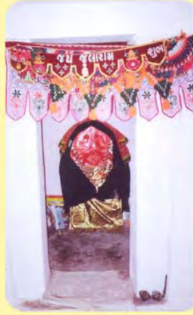
દેશામાનો પાળિયો ગામ : નાના ભાડિયા, પ્ર.-૪