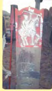
જાડેજા અલિયાજનો પાળિયો ગામ : કાનમેર, પ્ર.-૭