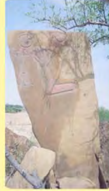
આહિરાણીઓ અને ઢોલીનો પાળિયો ગામ : વજવાણી, પ્ર.-૭