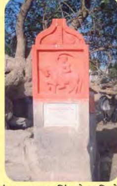
કુંવરજી સામતસિંહનો પાળિયો ગામ : ભુજ(છતરડી વિભાગ), પ્ર.-૩