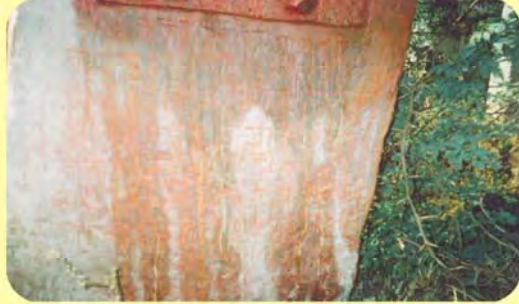
કરસનજીના પાળિયા નીચેનું લખાણ ગામ : ધાણેટી, પ્ર.-૩