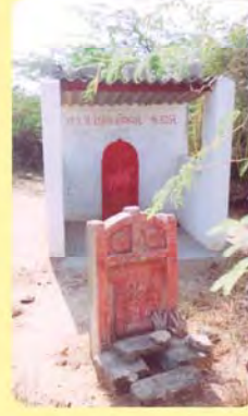
બહારનો શિવુભાની માતાનો પાળિયો ગામ : કુંદરોડી, પ્ર.-૫