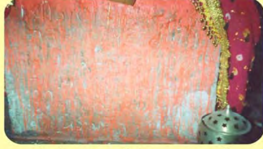
ક્રમાબાઈ સતીના પાળિયા નીચેનું લખાણ ગામ : લાખોંદ, પ્ર.-૩