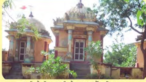
સતીઓની છતરડીઓ ગામ: ખોંભડી પ્ર.-૬