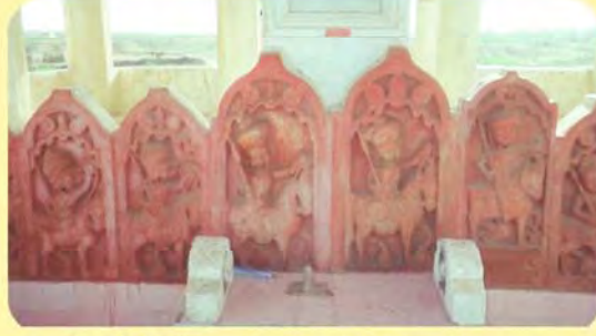
જમણેથી ચોથો વીર લાખાજનો પાળિયો ગામ: વિંઝાણ, પ્ર.-૮