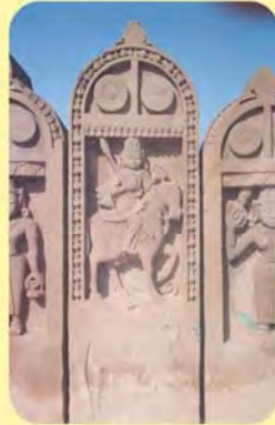
વચ્ચેનો જેહોજીનો પાળિયો ગામ : ભુજ(છતરડી વિભાગ), પ્ર.-૩