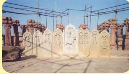
વચ્ચેનો લખપતજનો પાળિયો તથા બંને બાજુએ લખપતજની પાછળ સતી થયેલ સ્ત્રીઓના પાળિયા ગામ : ભુજ, પ્ર.-૩