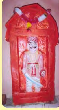
સુજાજીદાદાનો પાળિયો ગામ : મોટા કાંડાગરા, પ્ર.-૫