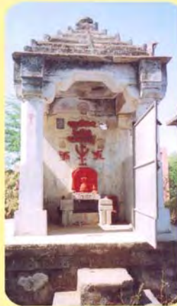
માનબાઈનો પાળિયો ગામ : ગઢશીશા, પ્ર.-૪