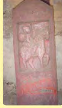
કેસરીસંગનો પાળિયો ગામ : બેલા, પ્ર.-૭