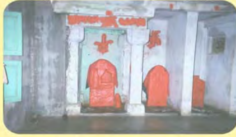
માનબાઈ સતીનો પાળિયો ગામ : ભોજાય, પ્ર.-૪