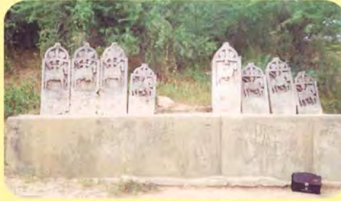
ડાબી બાજુથી ત્રીજો ભારમલજીનો તથા ચોથો દેવાજીનો પાળિયો ગામ: બિબ્બર, પ્ર.-૬