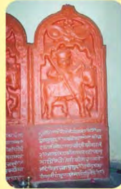
અજાજી નોંઘણજીનો પાળિયો ગામ : માનકૂવા, પ્ર.-૩