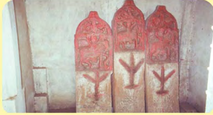
ડાબી બાજુથી પ્રથમ વિસોજી, વચ્ચે વીરલાખાજી તથા ત્રીજો ભીમોજીનો પાળિયો ગામ:નરા, પ્ર.-૮