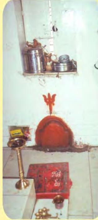
જામ અબડાના મંદિરમાં અબડાની ખાંભી ગામ:વડસર, પ્ર.-૮