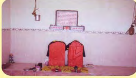
જમણી બાજુથી પ્રથમ કમાસતીનો પાળિયો તથા લાડુબાઈનો પાળિયો ગામ : જામથડા (સ્થળ : પંચગંગાજી), પ્ર.-૪