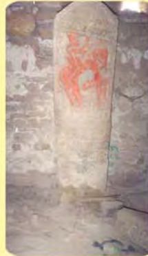
ચાંદોજનો પાળિયો ગામ : પલાંસવા, પ્ર.-૭