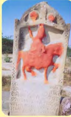
જાડેજા રાવજીનો પાળિયો ગામ : ઢોકળા પ્ર.-૪