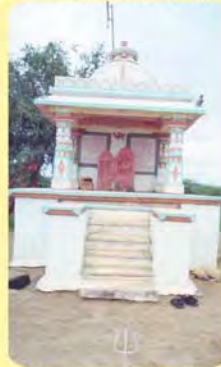
સતી કમઈબેન તથા હોથી ખીયરાજના પાળિયા પરની છતરડી, ગામ : મંજલ, પ્ર.-૬