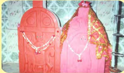
ડાબી બાજુથી પ્રથમ તમાચીજનો પાળિયો તથા બીજો આનંદકુંવરબાનો પાળિયો ગામ : ખોંભડી પ્ર.-૬