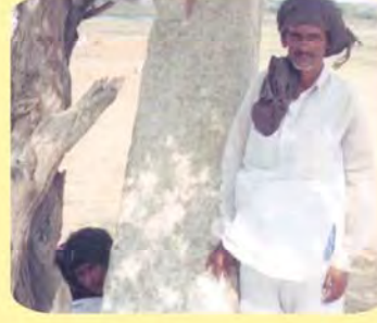
મીર અમીનહાજી ગામ : પલાંસવા