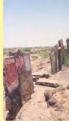
વીરોના પાળિયા ગામ : ભીમાસર, પ્ર.-૭