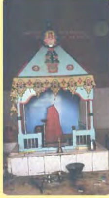
મોકાસતાની સમાધિ ગામ : ખારડિયા, પ્ર.-૬