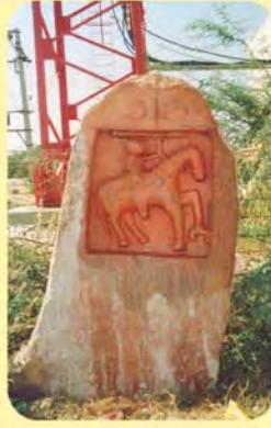
કરસનજીનો પાળિયો ગામ : ધાણેટી, પ્ર.-૩