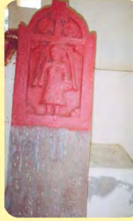
જશોદામાનો પાળિયો ગામ : વીંગણિયા, પ્ર.-૪