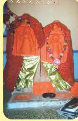
બેનબાઈ સતીના પાળિયા ગામ : લાખોદ, પ્ર.-૩