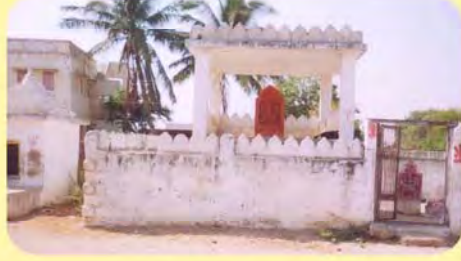
સત્તાબાવાનો પાગિયો ગામ : નવીનાળ, પ્ર.-૫