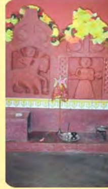
સતી સોનબાઈ ગામ : ઘાવડા(નાના), પ્ર.-૬