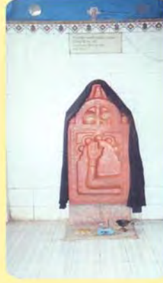
પ્રેમાસતીનો પાળિયો ગામ : મોરઝર, પ્ર.-૬