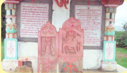
સતી કમઈબેન/હોથી ખીયરાજના પાળિયા ગામ : મંજલ પ્ર.-૬