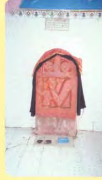
કમાસતીનો પાળિયો ગામ : મોરઝર, પ્ર.-૬