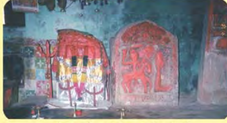
ડાબી બાજુનો સતી જીવણીનો પાણિયો ગામ: કાનમેર, પ્ર.-૭