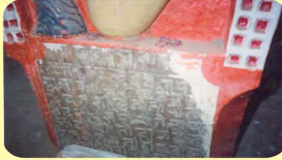
મચ્છર જ્ઞાતિના સતીમાનો પાળિયો(પાળિયા નીચેનું લખાણ) ગામ : ભુજ, પ્ર.-૩