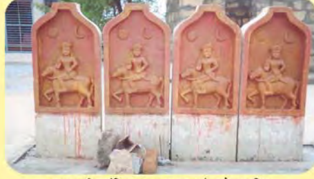
વાનુમા સતીના મંદિરના બહારના ભાગમાં આવેલા પાળિયા ગામ : મોરઝર પ્ર.-૬