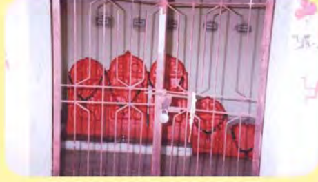
રૂઘા જોધીનો પાળિયો (ડાબેથી બીજો) ગામ : બાયઠ, પ્ર.-૪