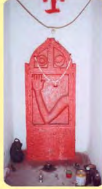
સતીમાનો પાળિયો ગામ : વીરાણિયા, પ્ર.-૫