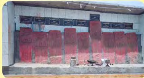
ગઢવીઓના પાણિયા ગામ: સુરબાવાંઢ, પ્ર.-૭