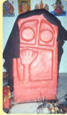
જીવામા સતીનો પાળિયો ગામ : લાખીયારવીરા, પ્ર.-૬