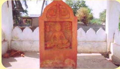
સતાબાવાનો પાળિયો ગામ : નવીનાળ, પ્ર.-૫