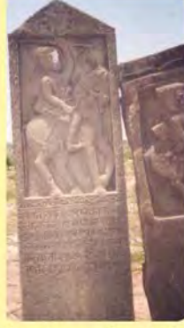
વાઘેલા વિભાજનો પાળિયો ગામ : ભીમાસર, પ્ર.-૭