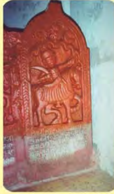
હોથી શ્રીવનાજીનો પાળિયો ગામ : કેરા, પ્ર.-૩