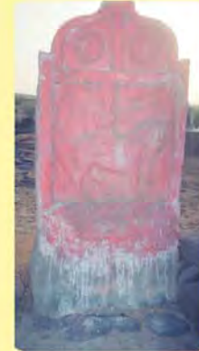
ટપુભા સાંગાજીનો પાળિયો ગામ : કાનમેર, પ્ર.-૭