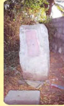
પુનશ્રીનો પાળિયો ગામ : સાડાઉ, પ્ર.-૫