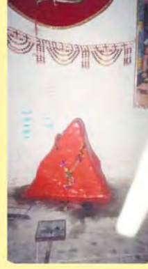
જશાજીનો પાળિયો / ખાંભી ગામ: બાલાસર, પ્ર.-૭