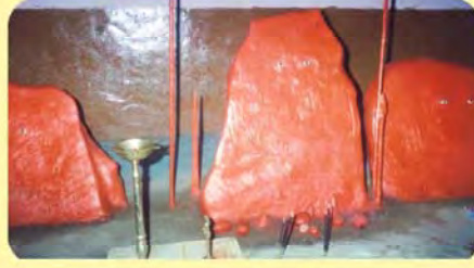
જગજીદાદાની ખાંભી ગામ: બાલાસર, પ્ર.-૭