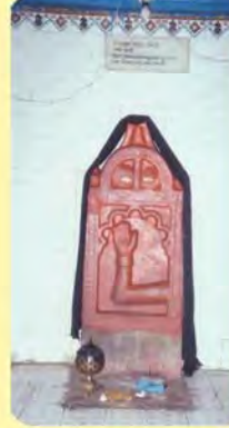
વાનુમાના દીકરી પાંબાસતીનો પાળિયો ગામ : મોરઝર પ્ર.-૬