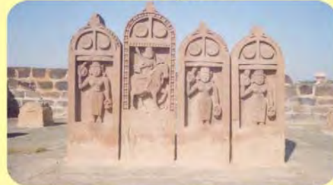
ડાબેથી પ્રથમ સજ્જકુંવરનો તથા બીજો જેહોજીનો પાળિયો ગામ : ભુજ પ્ર.-૩